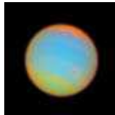
La 8ème et dernière planète du système solaire